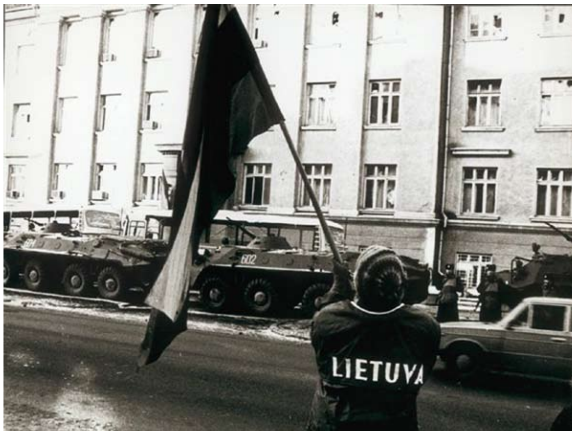
Šarvuočių kolonos 1991 m. sausį Vilniuje prie Radijo ir televizijos komiteto.